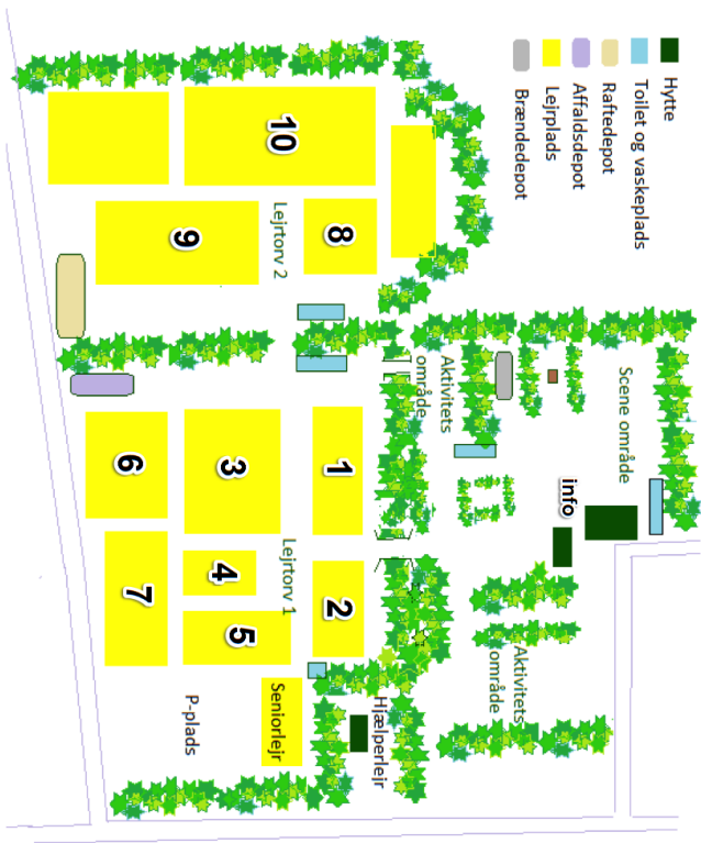
KORT OVER LEJRPLADSEN